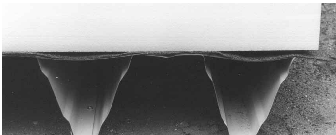
Vzorek ploché střechy s EPS před zkouškou na odkapávání hmot dle ČSN 73 0865

Zkušební vzorky tvořily výsek střešní konstrukce o vnějším rozměru 1500 x 1780 mm a obsahovaly dva spoje na trapézovém plechu. Dva totožné vzorky měly následující skladbu: