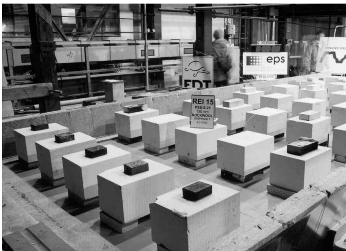
Úspěšná zkouška lehké ploché střechy s EPS na TR 150/280 (klasifikace REI 15 na rozpon 6 000 mm.)

Navržená konstrukce střešního pláště vyhoví REI 15 jak pro namáhání podle křivky normového požáru (1), tak REI r 15 pro namáhání podle křivky pomalého zahřívání (3) ze spodní strany konstrukce podle ČSN EN 1365-2. Tím jsou požadavky pro použití této střechy nad shromažďovacími prostory podle ČSN 73 0831 splněny.