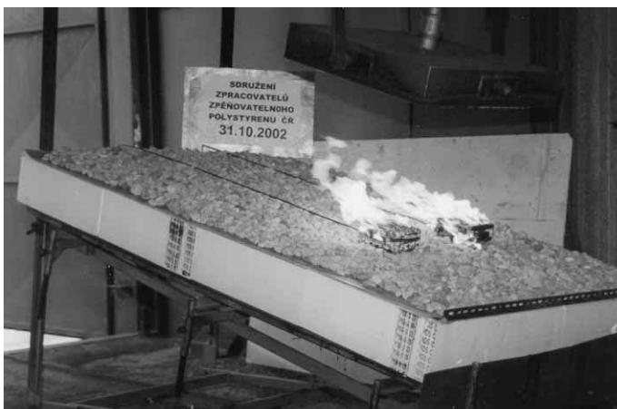
Zkouška s ochrannou vrstvou kačírku tl. 40 mm.

Dne 31.10.2002 byla provedena zkouška typu A. Složení vzorku od vrchní krytiny: