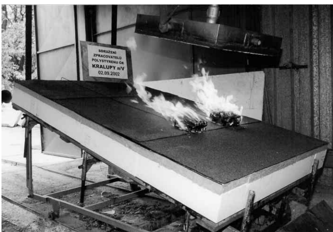
Zkouška s ochrannou vrstvou desek s MV tl. 40 mm.

Dne 2.9.2002 byla provedena zkouška typu A. Složení vzorku od vrchní krytiny :